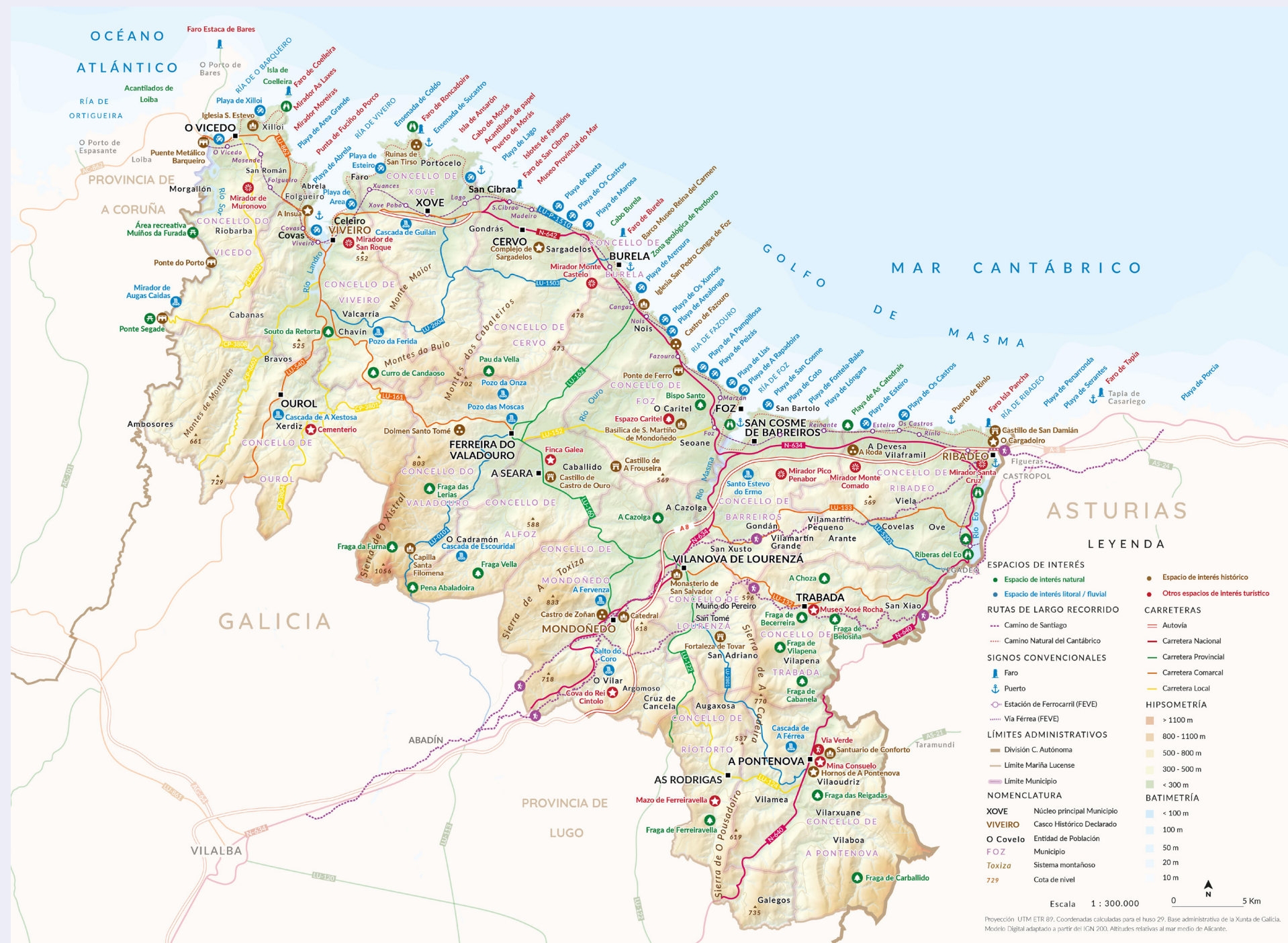
Plan de Sostenibilidad Turística en A Mariña Lucense

*LAS DISTANCIAS KILOMÉTRICAS SON APROXIMADAS